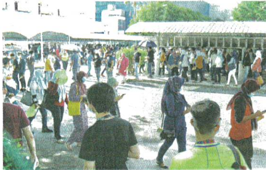
KIRA-KIRA 6,000 pekerja sebuah kilang di Bayan Lepas semalam beratur untuk menjalani ujian saringan Covid-19.

Kluster di lokap dan penjara melaporkan sebanyak 103 kes atau 11 peratus membabitkan Kluster Bakti (95 kes), Kluster Tembok (lima), Kluster GK Tawau