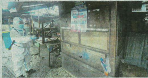
Anggota Bomba dan Penyelamat menyembur bahan sanitasi di tempat kawasan tumpuan penduduk pada Program Inisiatif Bersepadu Mengekang Penularan Covid-19 di Kampung Bahagia, Sandakan semalam.

Dalam pada itu menurutnya, Kementerian Kesihatan Malaysia (KKM) merekodkan kes baharu positif Covid-19 sebanyak 935 kes semalam. "Ini menjadikan jumlah kes