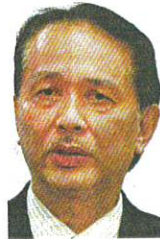
Tan Sri Dr Noor Hisham Abdullah

"The first five cases were tested positive following a screening for symptomatic individuals between Nov 21 and 25. As of today (yesterday), 651 individuals were screened, with 13 positive."